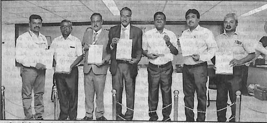
திருச்சி தேசியக்கல்லூரியில் நடைபெற்ற ஒருநாள் தேசிய கருத்தரங்கில் கலந்துகொண்டவர்களை படத்தில் காணலாம்.